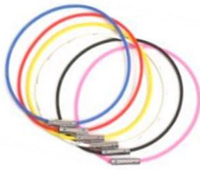
●ラウンドシュロスネックレス テラヘルツ仕様を着用