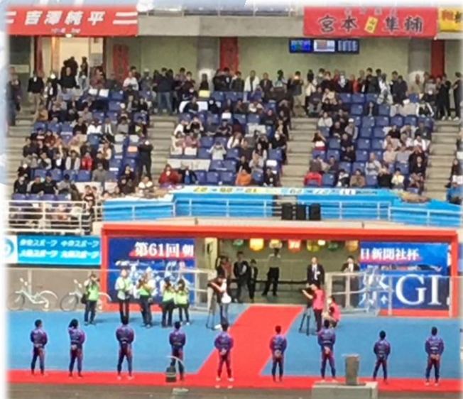
競輪発祥の地「小倉競輪」にて

決勝戦前のバックヤードでアップ前の激励に行ってきました。来年は賞金ランキング9位以内を目指して頑張りたいです。