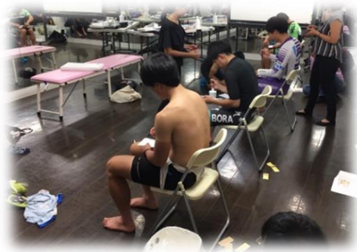
法政大学自転車部