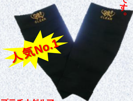
プラチナゲルマ ふくらはぎサポーター