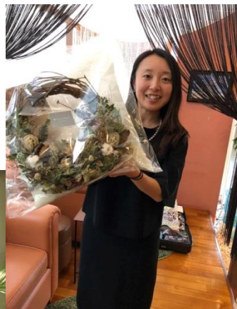
お祝いのお花もたくさん いただきました♡