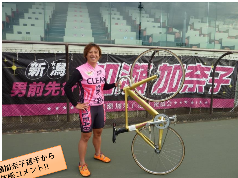
加瀬加奈子選手から体感コメント!!

ガールズケイリン開始時より、ずっとガールズを牽引している加瀬加奈子選手！あの橋本聖子氏の1kmタイムトライアルの記録を大幅に縮めた時からスポンサーをしています。来年開催のリオオリンピックに向けてさらに進化して頂きたいと思います。