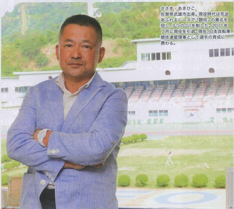
ささき・あきひこ 佐賀県武雄市出身。現役時代は気迫あふれるレースで『闘将』の異名を冠し、3つのG1を制した。2011年7月に現役を引退。現在、日本自転車競技連盟理事として選手の育成に携わる。