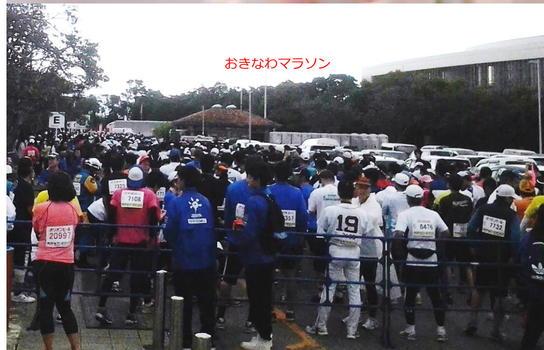
おきなわマラソン