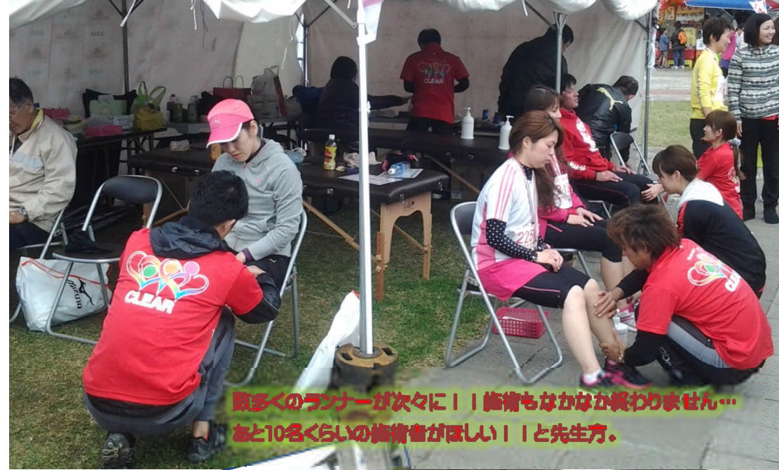
沢山のランナーが次々に！！施術もなかなか終わりません… あと10名くらいの施術者がほしい！！と先生方。

実際、トータルで何百人クリアを体感して頂いた のかわからなくなるほどでした。 「ビニューティバランス協会沖縄支部」の整体・カイ ロプラクティック等の治療院の約 10名の先生方は昼 食もとれず「日中バタバタでした。 先生方は、手際よく皆さんを施術して、CLEAR Rの説明も丁寧に行ってくださいました。 本当にありがとうございました！」