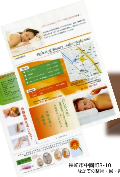
長崎市中園町8-10 なかその整骨・鍼・灸・マッサージ院内

「なかその整骨・鍼・灸・マッサージ院」に併設されたサロンが10月にOPEN。 『CLEAR製品』とビューティー&リフレッシュとして、小顔矯正・アンチエイジス対応のフェイシャルメニューと、骨盤矯正・冷え症を改善できるボディメニューを設定。 女性限定のサロンは、アロマの香りでゆっくりリラックスできる雰囲気になっています。 女性のストレス解消と、トラブルを本格的に改善できるサロンです。